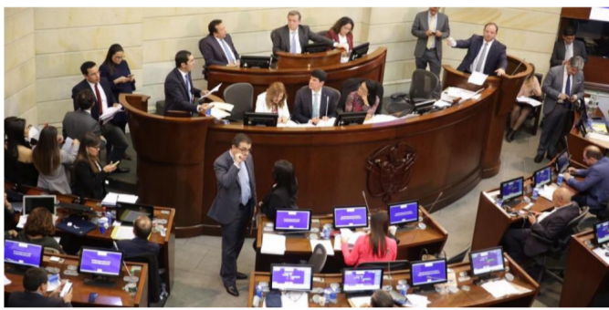
La próxima semana, las comisiones terceras y cuartas iniciarán el estudio del proyecto del Presupuesto 2020.

RELACIONADOS: ECOPETROL | MINISTERIO DE HACIENDA | PRESUPUESTO GENERAL 2020