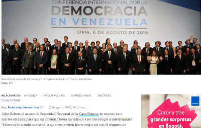
Reunión de cerca de 60 países en Lima para analizar la crisis en Venezuela.

RELACIONADOS: VENEZUELA | NICOLÁS MADURO | ESTADOS UNIDOS | SANCCIONES | DONALD TRUMP