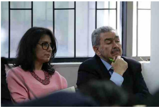
El expresidente de Reficar, Javier Genaro Gutiérrez es procesado por los millonarios sobrecostos de Reficar.

La Fiscalía General presentó formalmente el escrito de acusación en contra del expresidente de Ecopetrol, Javier Genaro Gutiérrez Pemberthy por su presunta participación y conocimiento en las irregularidades que se presentaron en el proyecto de modernización y ampliación de la Refinería de Cartagena (Reficar).