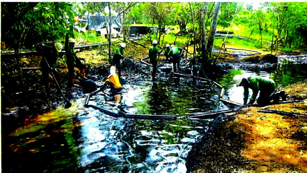
Las válvulas ilícitas de la línea Campo Tibú han afectado 4.000 metros de suelo y de cuerpos de agua.

GUSTAVO CASTILLO - CORRESPONSAL DE EL TIEMPO EN CUCUTA | @Litumaescritor