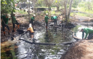
La instalación de las válvulas ilícitas provocan derrames de crudo, que contaminan la capa vegetal y los cuerpos de agua de esta zona de Norte de Santander.

Pero lo más grave de este fenómeno es la perversa huella de contaminación, que está deteriorando la naturaleza. Debido a los derrames originados por estas instalaciones rudimentarias, 4.000 metros de suelo y de cuerpos de agua han resultado afectados.