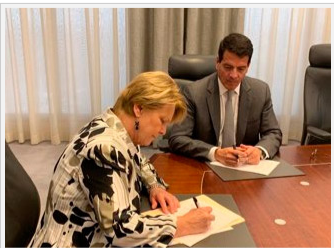
El sector privado, al igual que Ecopetrol, reacciona en forma diferente a las insulsas imposiciones

Esta simple y sencilla ecuación es la que Ecopetrol asumió con la iniciativa. Resulta que los llamados yacimientos no convencionales (YNC) , son lo que tanto el poder legislativo, la telaraña de tribunales colombianos, la democratización de grupos de interés (ong's) e infinidad de "expertos" consideran impropios para Colombia, o sea la explotación del "fracking".