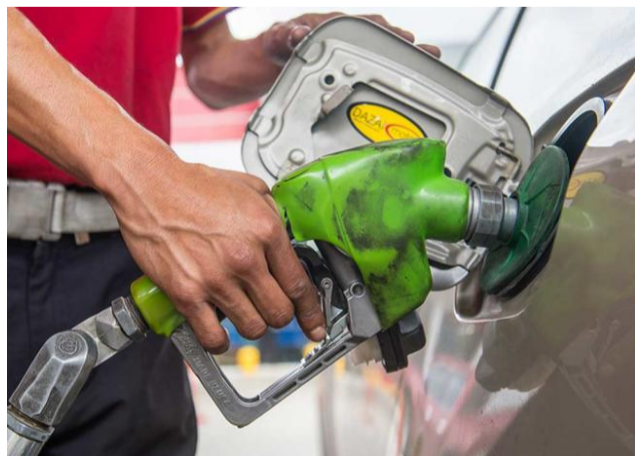
BLU Radio // Gasolina // Foto: AFP

Transportadores de carga, de pasajeros y vehículos particulares quedaron sorprendidos con el precio.