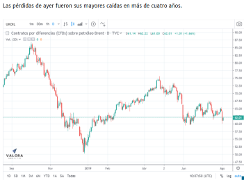
(The Wall Street Journal, Finviz, Investing, Markets Insider, Ámbito, 20 minutos, Valora Analitik).

Las pérdidas de ayer fueron sus mayores caídas de cuatro años.