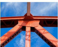
What are the benefits of infrastructure investment companies? The AIC