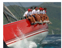
A Rate Cut Looms... ETF Global