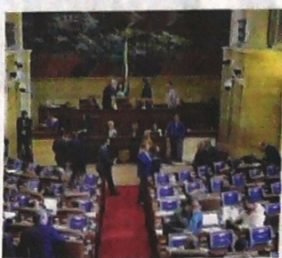
Los congresistas tiene esta semana para estudiar y aprobar el PND.

Según el Gobierno, uno de los grandes objetivos del PND es elevar del 2 % al 4 % el crecimiento anual del sector agropecuario. Con ese fin se incluyeron inversiones para el campo por $227,4 billones, al igual que la pres-