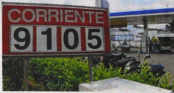
El precio de los combustibles en Colombia no tendría variación a la baja por la reducción del IVA propuesto por el Gobierno en el PND.

Se calcula que el 50 % del costo de la gasolina lo conforman tributos y contribuciones como Impuesto Nacional, IVA del fósil, tarifa de marcación, impuesto al carbono, tarifa de transporte, sobretasa, entre otros.