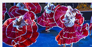
Colombia celebra la Danza