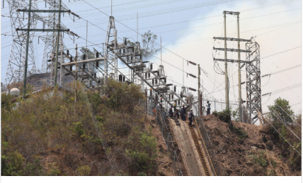
Siete claves para entender lo que pasa con la energía en Venezuela. Venezuela siguió paralizada por un segundo apagón que detuvo la actividad del país petrolero y sumió en la desesperación a sus habitantes, sin solución a la vista. ¿Qué está pasando? EE ESPECTADOR.COM / 28 mar.

Para de Alba, si todavía quedaba alguna operación entre PDVSA y cualquier empresa estadounidense o con compañías que utilicen el sistema financiero de Estados Unidos, "a partir del 28 no cabe duda de que las sanciones están en vigencia y cualquier compañía asume unos riesgos mayores de lo que asumiría antes de esa fecha".