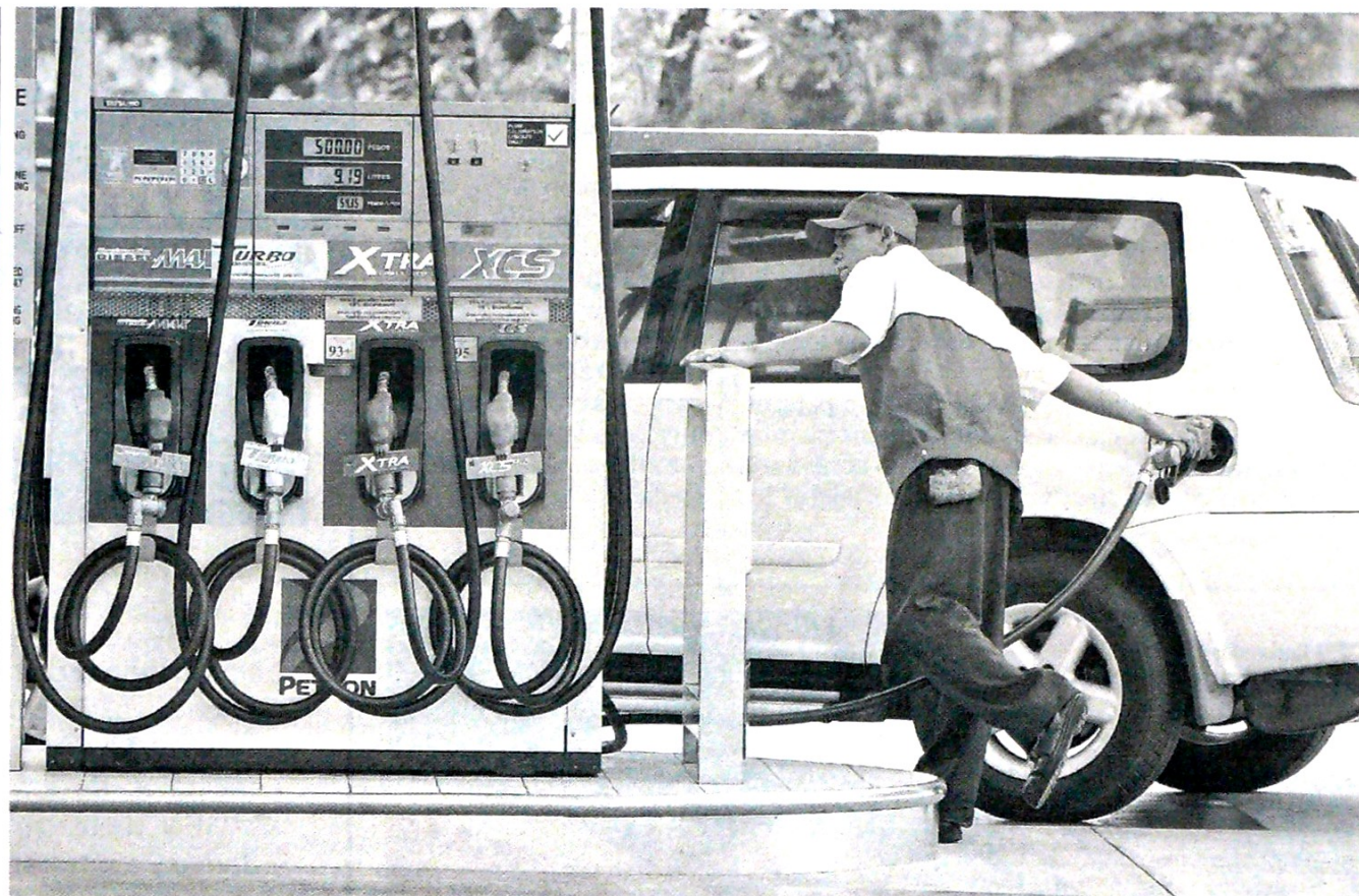
La emisión de TES para cubrir el faltante del FEPC se aprobó en el 2018, en la ley del Presupuesto General de la Nación.

Así las cosas, estos recursos, que ascienden a $1,8 billones, serán destinados al cubrimiento del déficit del primer semestre del 2018, de los cuales la mayor parte corresponde a recursos de Ecopetrol ($1,5 billones), en