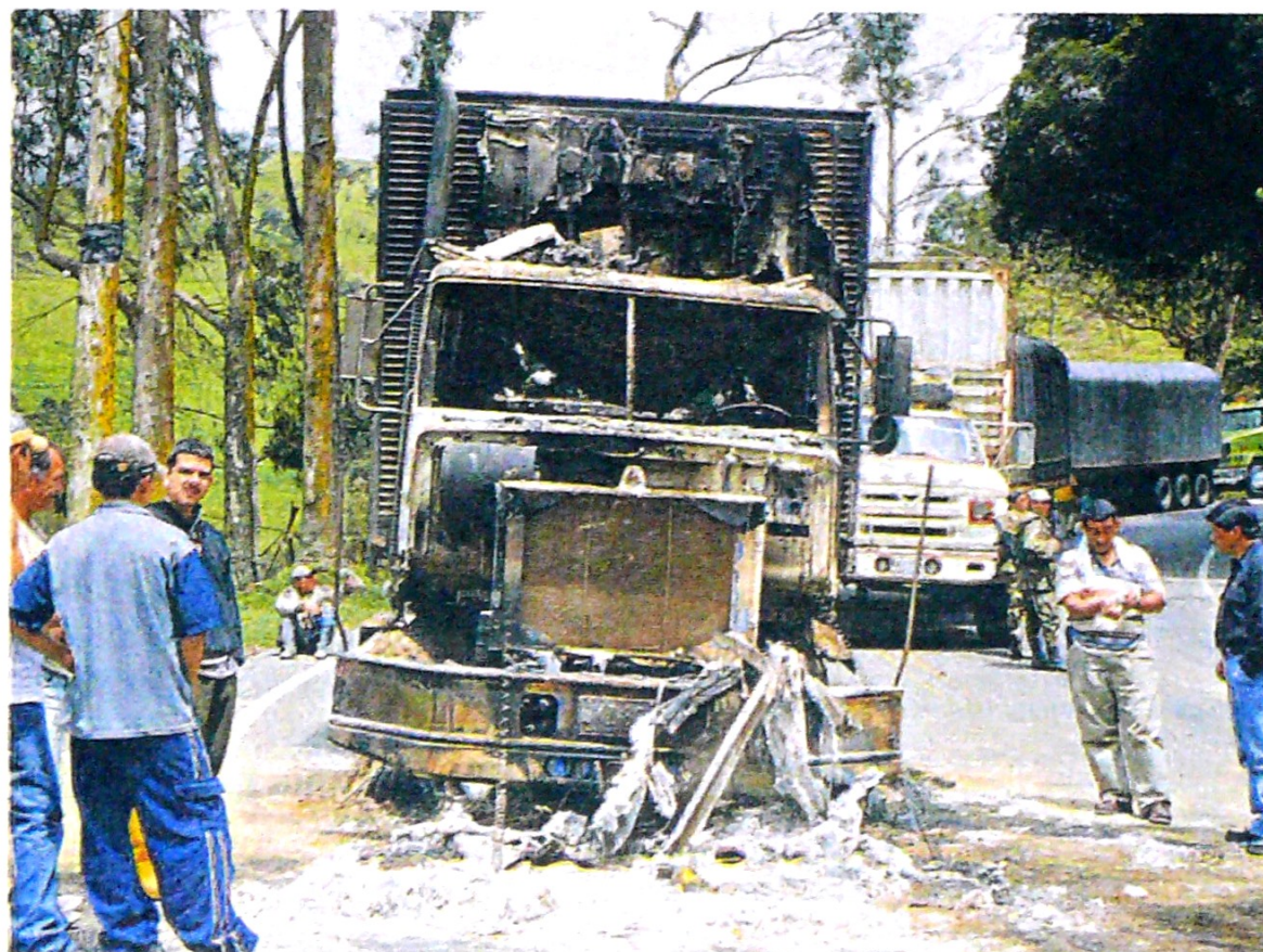
Entre 2018 y 2019 se reportaron 106 ataques, y 45 camiones fueron incinerados en las vías del país.

Empresarios del sector dicen que es urgente actualizarla e incluir el valor de la carga. Pág. 10