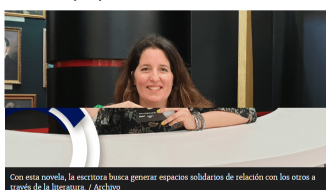
Con esta novela, la escritora busca generar espacios solidarios de relación con los otros a través de la literatura.

La escritora argentina llega a la Feria del Libro de Bogotá para hablar de su más reciente novela, con la que logró el Premio Clarín 2017 y la que representa una distopía sobre un mundo donde se autoriza la crianza de seres humanos para que sean el alimento de otros.