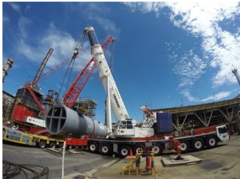
Ecopetrol reiteró la importancia que tienen los contratistas de cumplir con las obligaciones laborales y de seguridad social con sus trabajadores, así como el asegurar el cumplimiento de estas por parte de sus subcontratistas y proveedores, lo mismo que los acuerdos comerciales.

Compartir en Facebook Compartir en Twitter G+ P