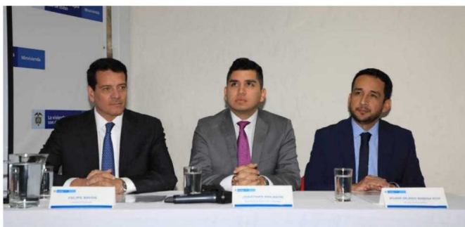
El presidente de Ecopetrol, Felipe Bayón Pardo, el ministro de Vivienda, Jonathan Malagón, y alcalde de Villavicencio, Wilmar Barbosa, durante la firma del convenio.

RELACIONADOS: META | VILLAVICENCIO | ACUEDUCTO