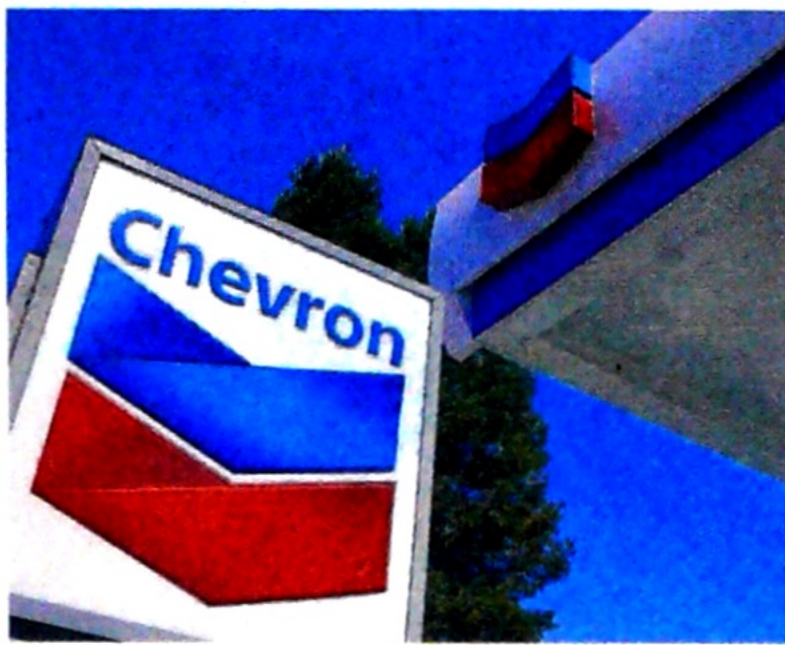
El 12 de abril Chevron informó del acuerdo con Anadarko.

"Estamos muy confiados. Nuestra propuesta es"