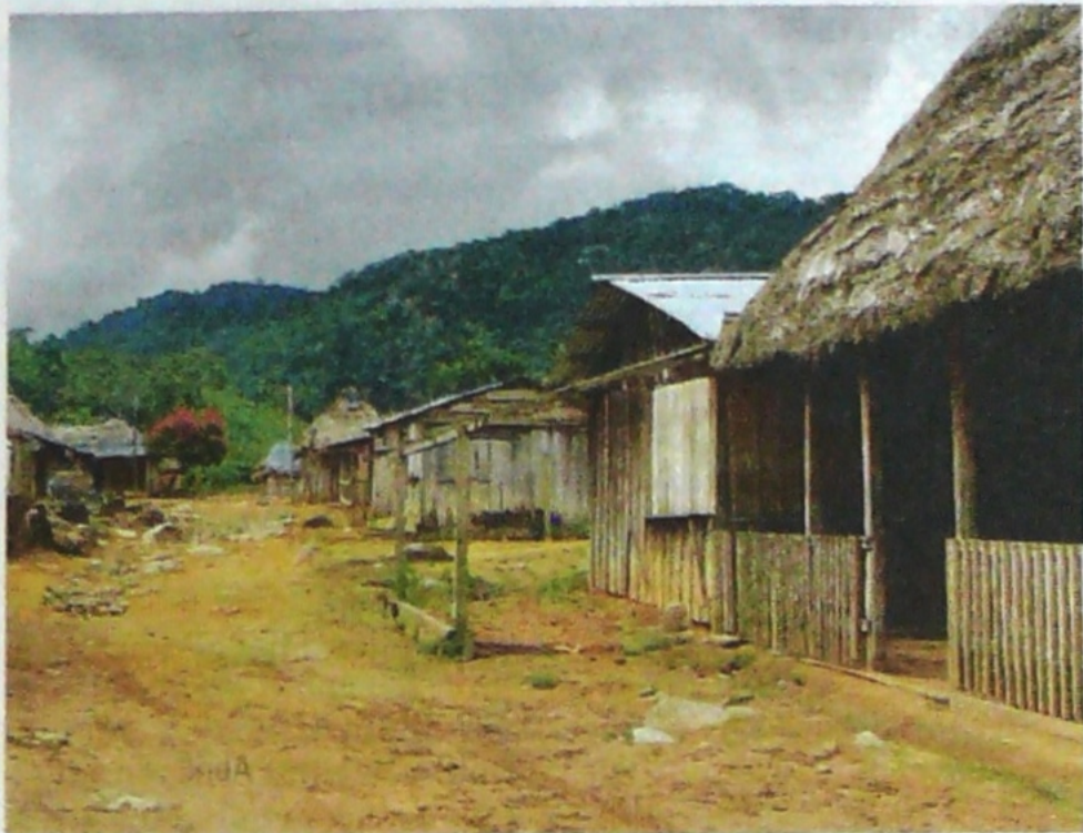
La FAO lanzó la estrategia para encontrar soluciones individuales en el campo. En la foto: Sur de Bolívar.