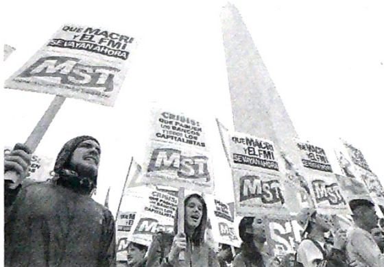
El PIB argentino registrará un crecimiento negativo de 1,2%.