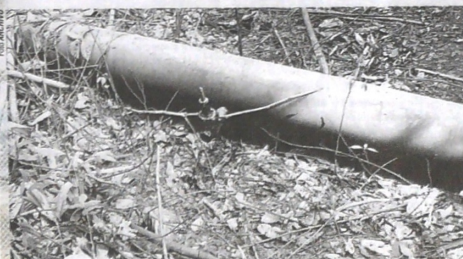
LA RECUPERACIÓN DE LOS ECOSISTEMAS afectados por atentados, requiere planes de largo plazo.