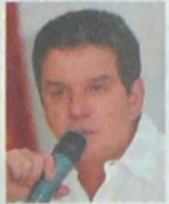
Luis Miguel Morelli

Opinión, el exgobernador de Norte de Santander anunció que con este propósito, contratarán un estudio integral que se encargará de determinar la oferta de gas en el departamento y la demanda del mismo en Cúcuta y sus alrededores, así como las alternativas que existen para el trazado de un gasoducto en la región.