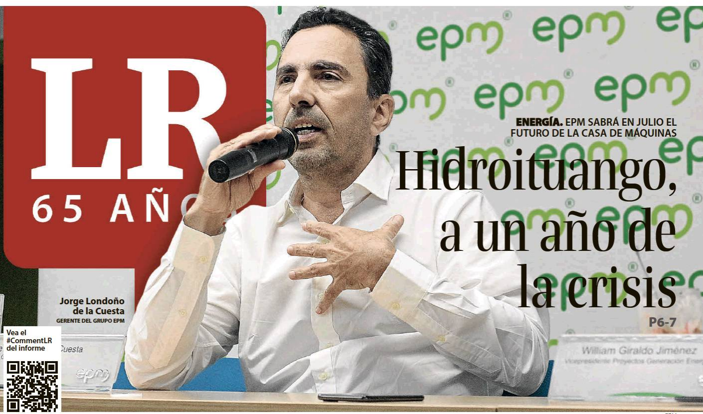
ENERGÍA. EPM SABRÁ EN JULIO EL FUTURO DE LA CASA DE MÁQUINAS