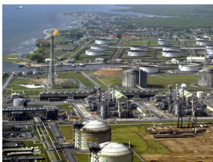
En noviembre, Estados Unidos reimpuso sanciones sobre las exportaciones de petróleo iraní.

A las 11:50 de la mañana, hora colombiana, los precios del petróleo subían con fuerza en los mercados internacionales debido a la decisión de Estados Unidos de no renovar las exenciones que permitían a algunos países comprar crudo iraní, lo que reducirá más los suministros.