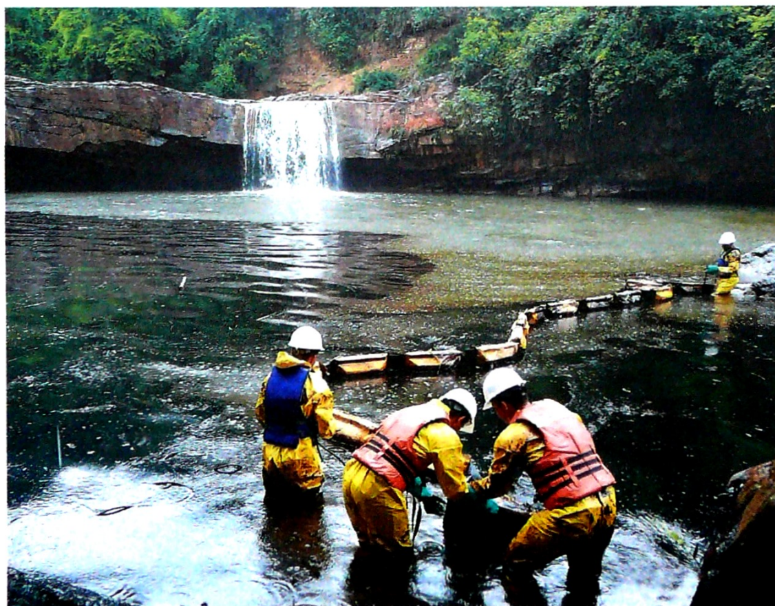
Según Ecopetrol los departamentos más afectados son Norte de Santander, Arauca, Nariño y Putumayo.

La primera voladura contra el oleoducto Caño Limón-Coveñas se registró el 14 de julio de 1986, en el municipio de Carmen de Tonchalá, Norte de Santander, que ocasionó el derrame de 45.743 barriles de petróleo. ■