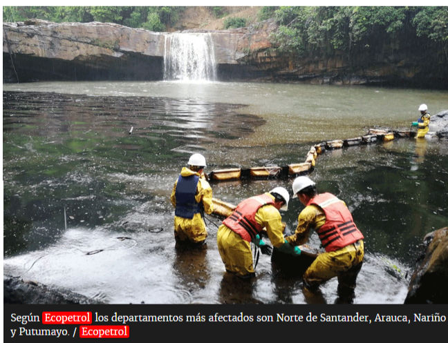
Según Ecopetrol los departamentos más afectados son Norte de Santander, Arauca, Nariño y Putumayo.

En 2018 el costo de las reparaciones derivadas de los atentados y de las válvulas ilícitas en los sistemas de transporte fue cercano a los $157.000 millones.