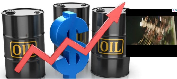
Petróleo se dispara ante anuncios de Estados Unidos sobre Irán

Estados Unidos anunció este lunes que no renovará las exenciones que permitían a ocho países comprar petróleo iraní, en un intento por presionar al principal producto de exportación de la República Islámica.