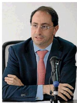
Ministerio de Comercio

Durante su intervención, el jefe de la cartera de Comercio, Industria y Turismo también explicará a los asistentes que el país ofrece diferentes instrumentos y beneficios tributarios que posicionan a Colombia como un