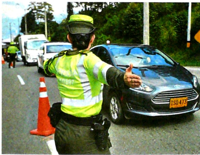
Más de 30.000 policías custodian las carreteras del país, según la Dirección de Tránsito y Transporte.

Desde el 12 de abril se ha registrado un flujo de 6,2 millones de vehículos. Según el general Rodríguez, en cerca de un 80 por ciento de los siniestros registrados se han visto involucrados los motociclistas.