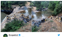
Personal de Ecopetrol trabaja a esta hora en Pozo Azul, lugar emblemático y turístico de Tibú, para hacer limpieza del crudo derramado luego del atentado contra el Oleoducto Caño Limón - Coveñas. #CuidemosElTubo #NoMásAtentados #NuestroPozoAzul