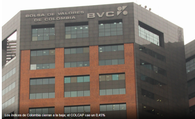
Los índices de Colombia cierran a la baja; el COLCAP cae un 0,45%

Investing.com – La Bolsa de Colombia cerró con descensos este jueves; los retrocesos de los sectores industria , servicios públicos , y agricultura impulsaron a los índices a la baja.