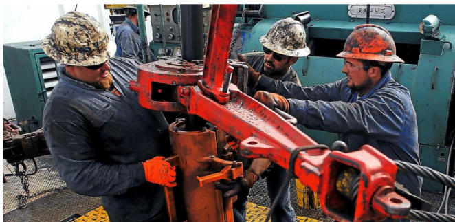
La producción de crudo en el país creció 5,4 por ciento en el primer trimestre de 2019.

RELACIONADOS: PETRÓLEO | MINISTERIO DE MINAS Y ENERGÍA | PETRÓLEO EN COLOMBIA | PRODUCCIÓN | CRUDO