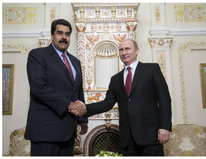
Venezuela ha encontrado en Rusia un "aliado estratégico" de su política multilateral, así como un proveedor de armamento, tecnología y otros recursos.

E l presidente Nicolás Maduro está usando al gigante energético ruso Rosneft para canalizar el flujo de efectivo de las ventas de petróleo de Venezuela, para evadir sanciones con las que Estados Unidos busca sacarlo del poder, según fuentes y documentos revisados por Reuters.