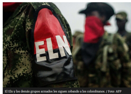
El Eln y los demás grupos armados les siguen robando a los colombianos.

Editorial 18 Abr 2019 - 12:00 AM Por: El Espectador