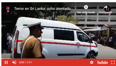
Terror en Sri Lanka: ocho atentados el Domingo de Resurrección hace 1 hora