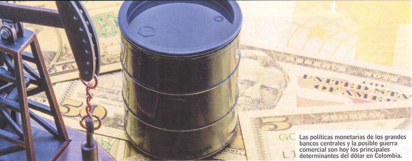
Las políticas monetarias de los grandes bancos centrales y la posible guerra comercial son hoy los principales determinantes del dólar en Colombia.