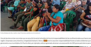
Comunidad del alto medio y bajo Putumayo asistieron a la Audiencia

Le puede interesar: Orto: Cinco décadas de extractivismo en la Amazonia