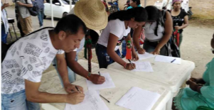
Es momento de firmar el acuerdo de soberanía territorial

Una de las denuncias concretas que se escuchó durante la Audiencia fue la irresponsabilidad de las multinacionales que hacen presencia en la región. Empresas como Ameriur, AngloGold Ashanti, Veta y Petrocontrol no asumen responsabilidad frente al daño ambiental que le está generando a sus municipios. En Puerto Asís, por ejemplo, está programado alcanzar una excavación de 200 pozos petroleros para el año 2020.