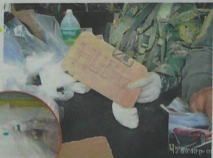
LOS LABORATORIOS PERTENECEN al frente Juan Fernando Porrás de la guerrilla del Eln.

Por ahora, las autoridades continúan adelantando investigaciones para contrarrestar el negocio del narcotráfico de los grupos armados ilegales.