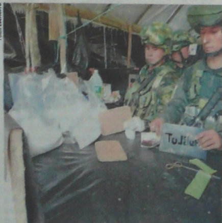
EN LOS LABORATORIOS HABÍA 390 kilos de clorhidrato de cocaína y al menos 99 kilos de base de coca.

Miembros de la Policía y del Ejército se adentraron en la zona boscosa de las veredas El Serpentino y Socuavo de Tibú, para dismantelar y destruir un complejo cocalero del Ejército de Liberación Nacional (Eln), valorado en al menos 4.500 millones de pesos.