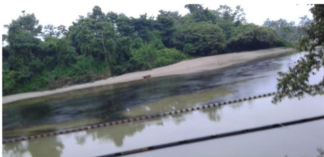
Se registró una ruptura en las barreras instaladas para retener el derrame de crudo en la zona.

RELACIONADOS: ECOPETROL NORTE DE SANTANDER