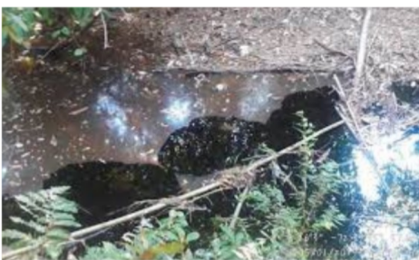
En 2018, la infraestructura petrolera colombiana sufrió 107 atentados

Caracas - El oleoducto Caño Limón-Coveñas , uno de los principales de Colombia, sufrió un segundo atentado terrorista en menos de 72 horas por parte de desconocidos en la región del Catatumbo, informó este martes la petrolera estatal Ecopetrol .