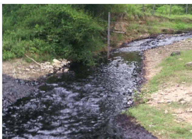
BLU Radio. Caño Limón. Foto suministrada y de referencia.

El derrame afecta el sitio turístico de la región como lo es Pozo Azul.