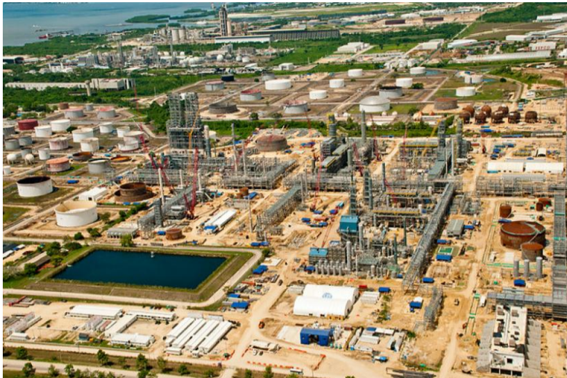
La Refinería de Cartagena (Reficar)