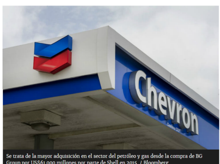
Se trata de la mayor adquisición en el sector del petróleo y gas desde la compra de BG Group por US$61.000 millones por parte de Shell en 2015.

La adquisición intensifica una batalla contra Exxon para convertirse en la principal compañía energética de Estados Unidos.