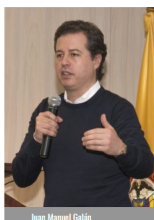
Juan Manuel Galán

"Existe un aumento considerable en la rotación de sustancias psicoactivas en Combia. Hay en la actualidad 389, y en este año hemos encontrado 39 nuevas", manifestó Freddy Becerra, Ministro de Salud en el Foro Retos y Desafíos para la prevención interinstitucional del consumo de drogas, organizado por la Universidad de La Salle en Bogotá.