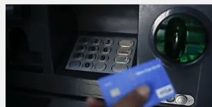
Bancos no atenderán al público el jueves y viernes santo