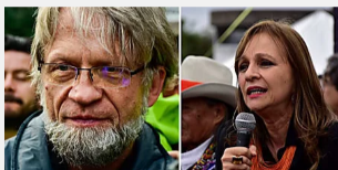
Consejo de Estado dejaría sin curules a Mockus y Ángela Robledo