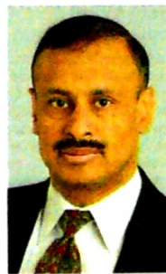
El jefe de la misión para Colombia del FMI, Hamid Faruque.

El crecimiento impulsado por la demanda interna refleja un fuerte consumo privado y una modesta recuperación de la inversión, mientras que las exportaciones siguen siendo lentas en general. Los datos más recientes, por ejemplo de los indicadores de confianza del sector privado, producción industrial, ventas minoristas y ventas de automóviles, continúan sugiriendo que esta recuperación cíclica continúa.