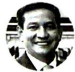
Guillermo Criado Presidente Cámara Colombiana de Confecciones

“Queremos que el Gobierno ponga normas comerciales justas y que haya un equilibrio para que nuestro sector siga avanzando y generando empleo en el país”.