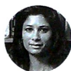
Gita Gopinath Economista jefe del Fondo Monetario Internacional

“Brasil ha tenido problemas para aprobar la legislación en materia fiscal que necesita y la incertidumbre en México continúa con el gobierno actual, que no ha dado lineamientos claros”.