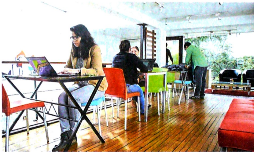
Las sanciones podrían llegar hasta el 200 % del aporte omitido.

"Se arriesga a no poder garantizarle unos niveles adecuados de subsistencia a su familia. Está también el tema de la solidaridad con los que no tienen capacidad económica, lo que se financia con una parte de los aportes", señala la funcionaria ante el frecuente reclamo de los que son requeridos por la UGPP.