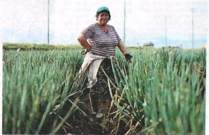
Cultivo de cebolla larga —o junca— en Aquitania, Boyacá. En este municipio, cerca de la laguna de Tota, trabajan hija (izquierda) y madre (arriba) en el cultivo.