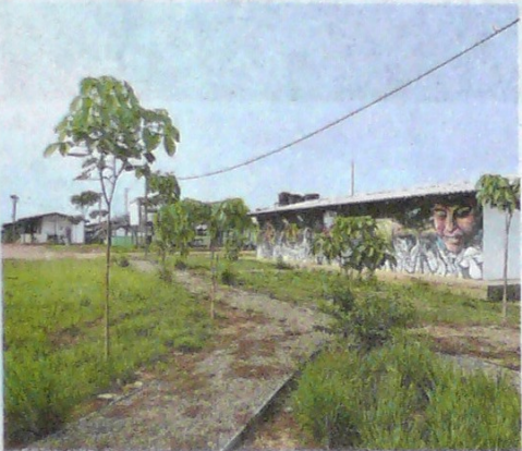
En Charras, vereda de San José del Guaviare, ni siquiera tienen electricidad o agua.